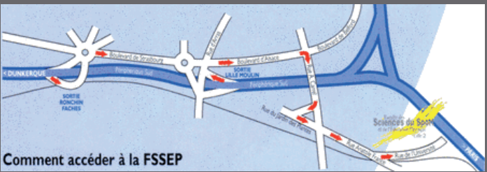
Comment accéder à la FSSEP

En venant de la gare, prendre le métro ligne 2 - Direction St Philibert. Arrêt Porte de Douai (4ème station). Poursuivre à pieds ou en bus - Direction Ronchin (ligne 14 arrêt Gaston Berger). Traverser le complexe sportif José Savoye.